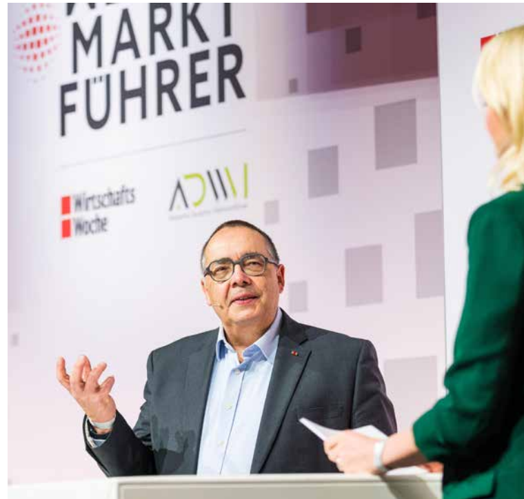
Prof. Helmut Krcmar teilt Insights und Impulse zur digitalen Transformation

Für Prof. Krcmar steht fest: Es braucht eine gemeinsame Vision. Und das Verständnis darüber, dass es nicht nur eine Wahrheit gibt. Auf die Kernfragen der digitalen Transformation sind viele Antworten möglich, die jedes Unternehmen durch Ausprobieren für sich selbst finden muss.